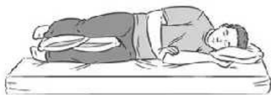
نحوه صحیح خوابیدن بر روی پهلو